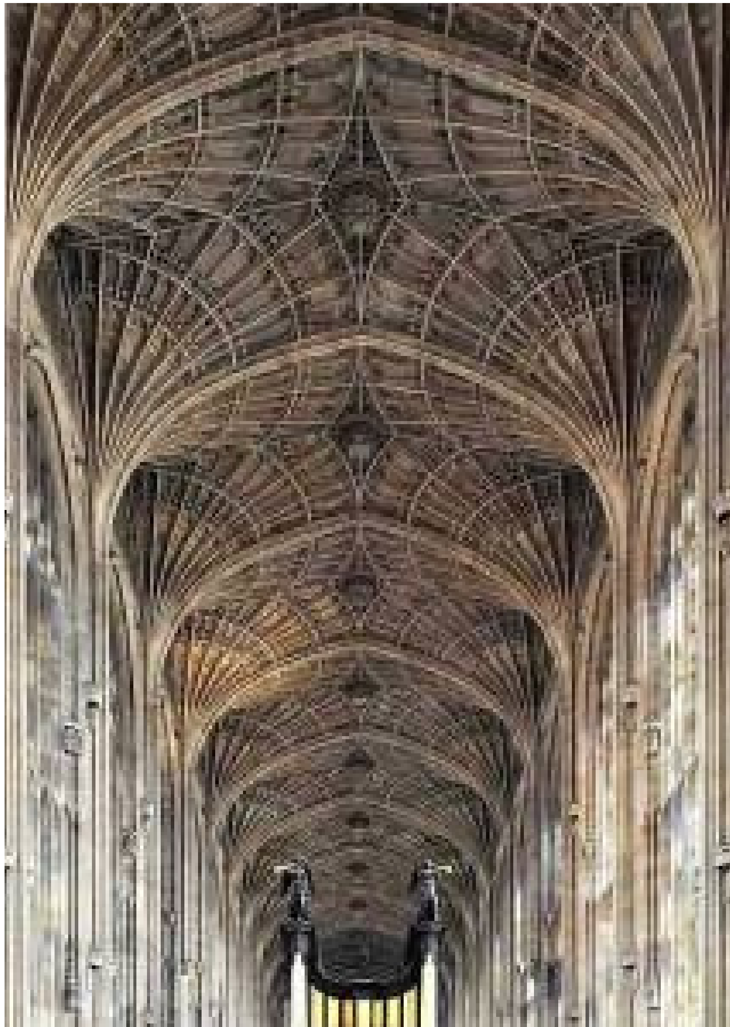
załącznik nr 2