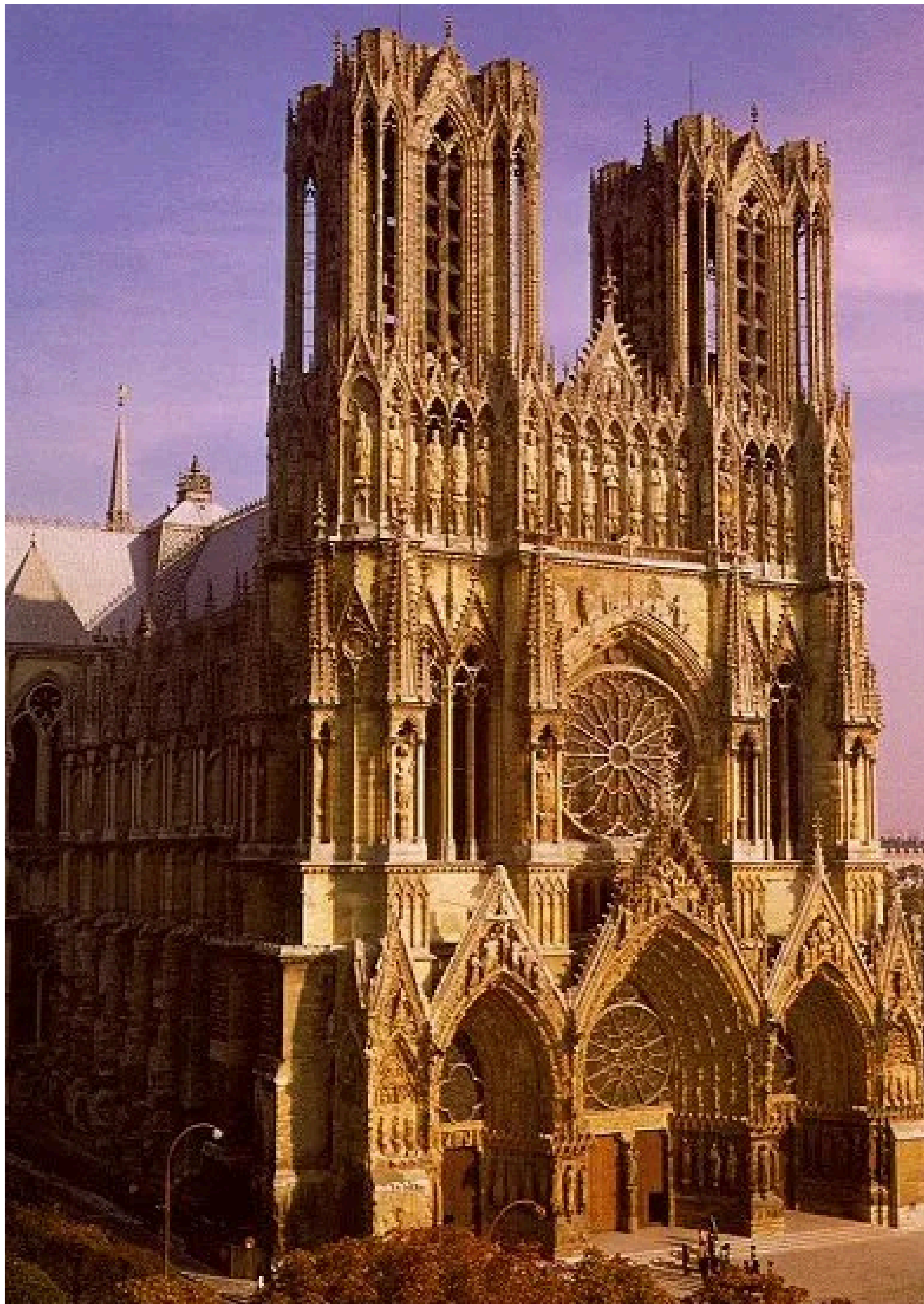
załącznik nr 1